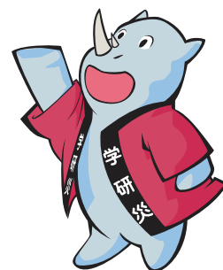
学研災キャラクター サイちゃん