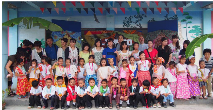
パグアサ・ラーニング・センター訪問